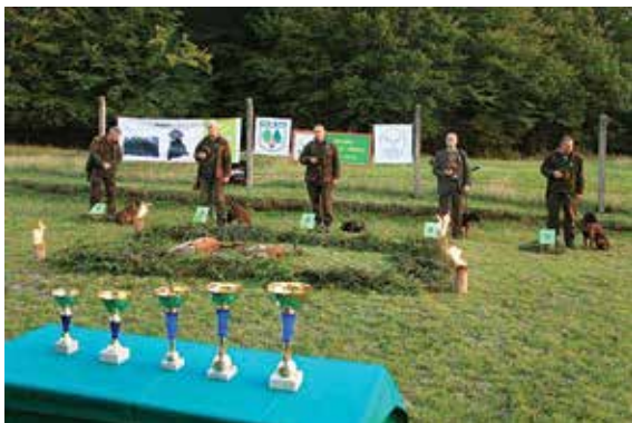
Ukončenie IV. ročníka skúšok o cenu Hontu a Hrona