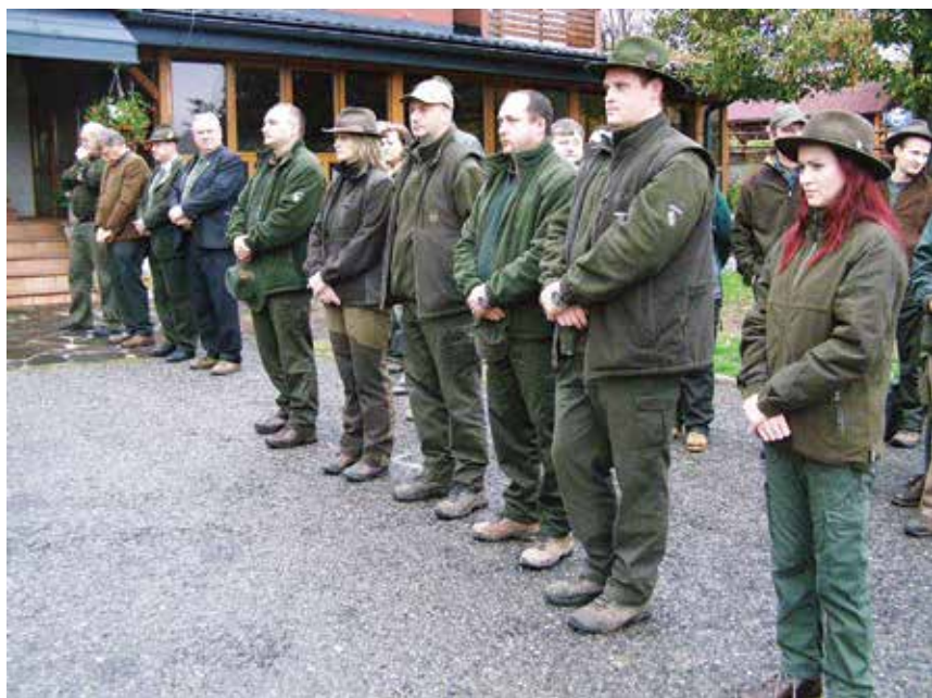
Usporiadatelia a hostia pri slávnostnom otvorení skúšok

aj pri ukončení, kde prvý čas na stope bol niečo cez 10 min a vodič so psom (mal 1 znak) sa žiadal nezapočítať čas a šiel späť hľadať posledný znak na ležovisku, znak nenašiel.