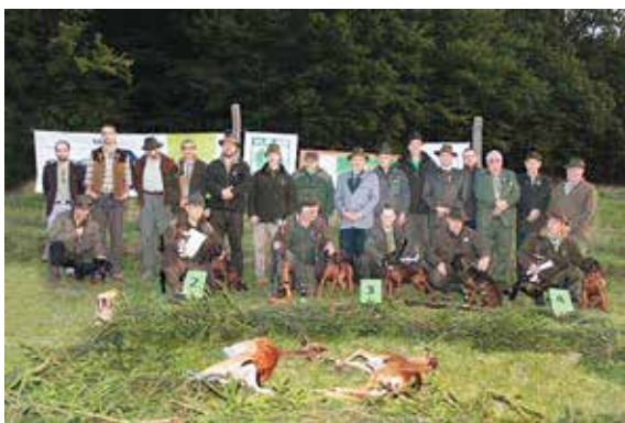
Foto na pamiatku účastníkov skúšok