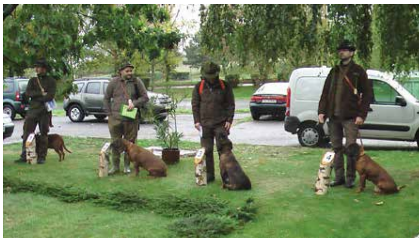
Nastúpení aktéri počas otvorenia skúšok