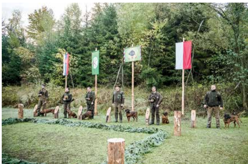
Aktéri skúšok počas slávnostného otvorenia