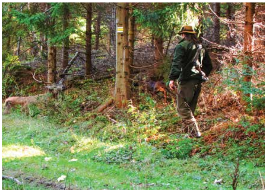
Karol Divok s BF HASOU spod Oravského hradu na umelej poľarbenej stope