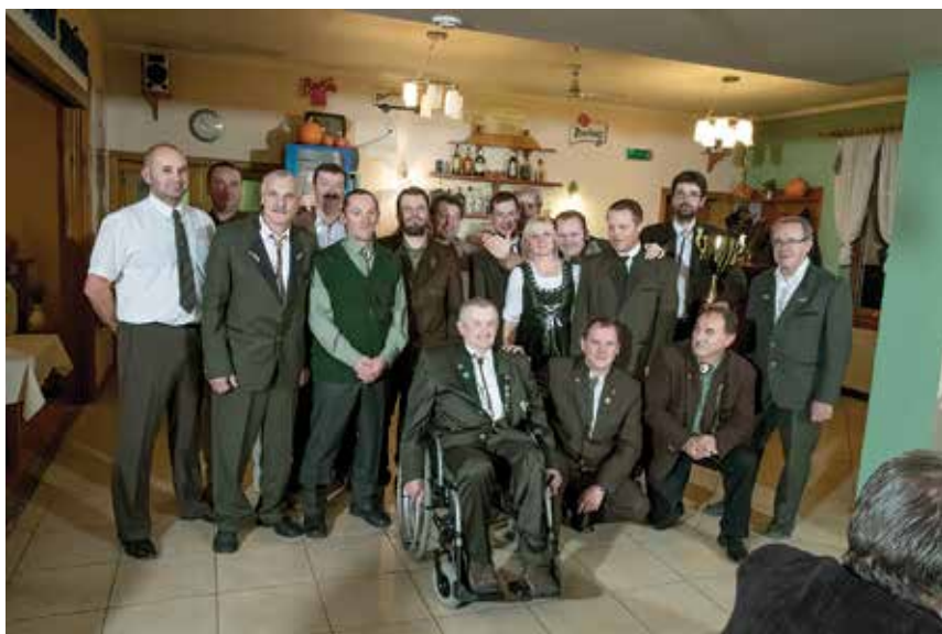
Foto na pamiatku po úspešnom VII. ročníku skúšok O spišský pohár