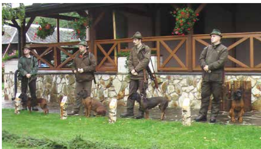
Nastúpení aktéri počas otvorenia skúšok